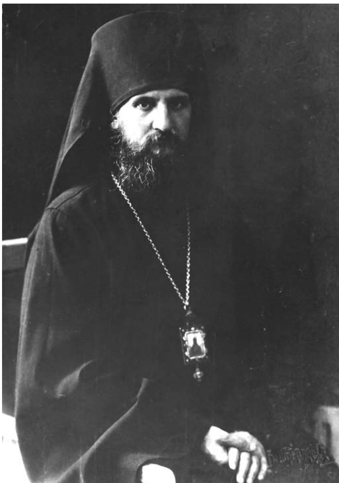
Епископ Уфимский Андрей (Ухтомский)