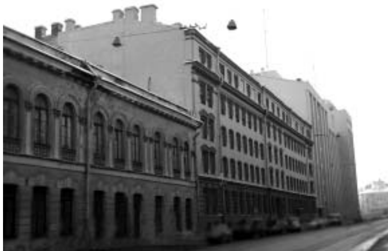
Дом предварительного заключения на Шпалерной, 25 — внутренняя тюрьма ОГПУ в Ленинграде