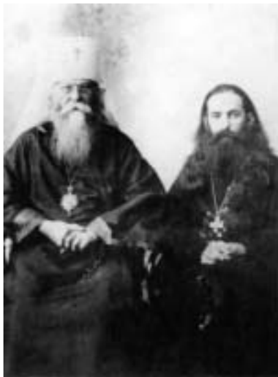
Митрополит Иосиф и протоиерей Александр Советов