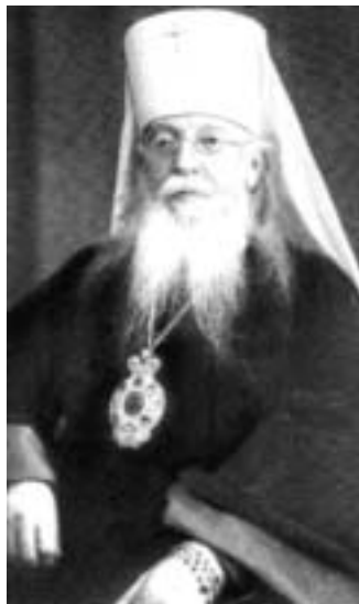
Митрополит Ярославский Агафангел (Преображенский)