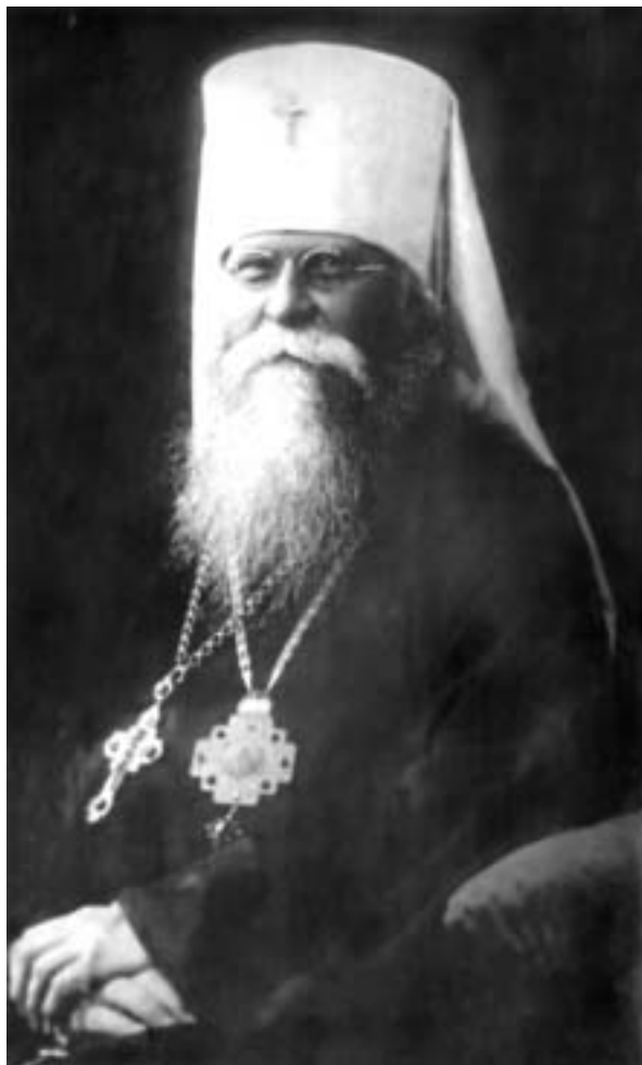
Митрополит Петроградский Иосиф