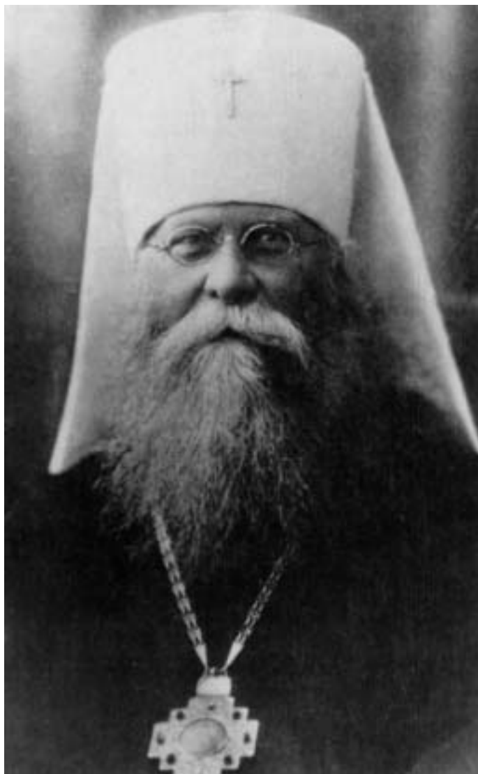
Митрополит Иосиф (Петровых)