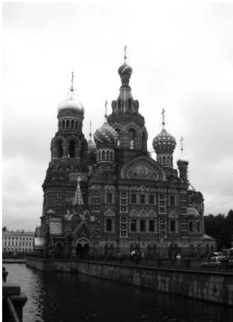
Кафедральный собор Петроградской епархии — храм Воскресения Христова на крови