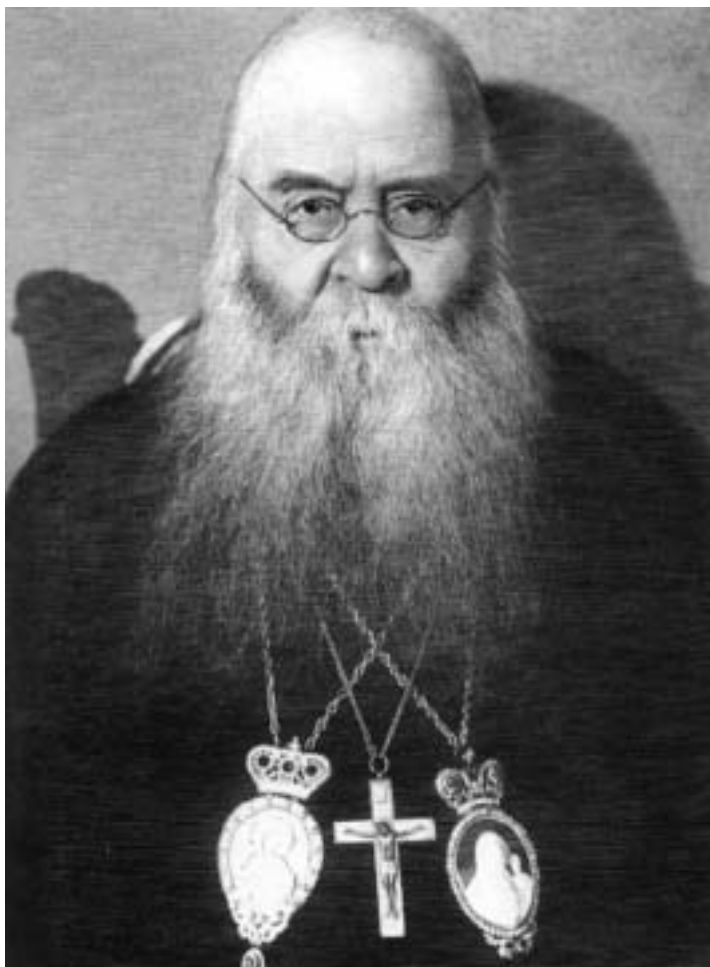
Митрополит Сергей (Страгородский)