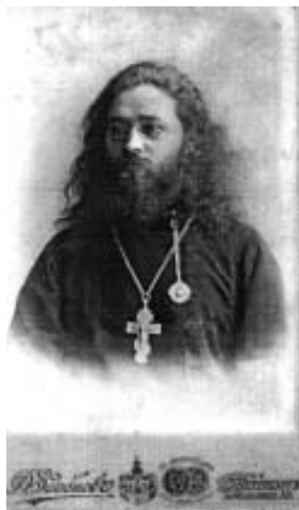
Протоиерей Иоанн Никитин