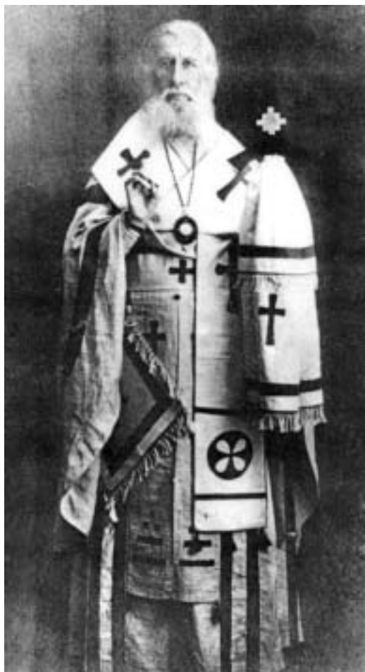
Архиепископ Гдовский Димитрий (Любимов)