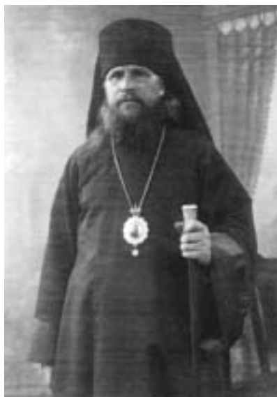
Архиепископ Угличский Серафим (Самойлович)