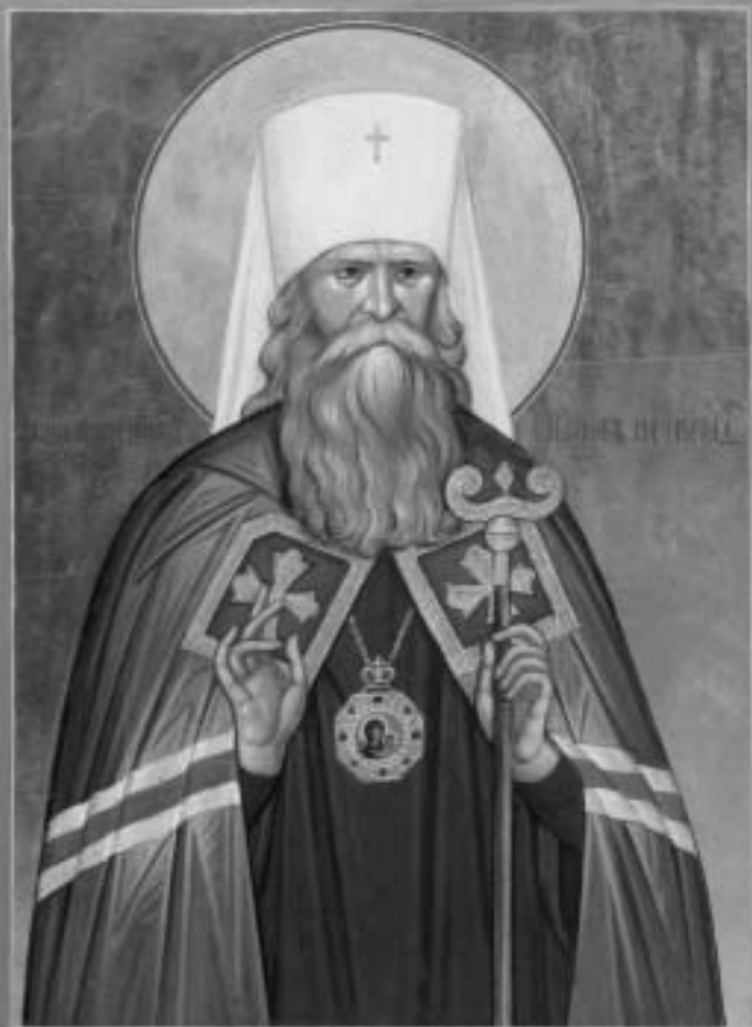
Икона священномученика Иосифа, митрополита Петроградского