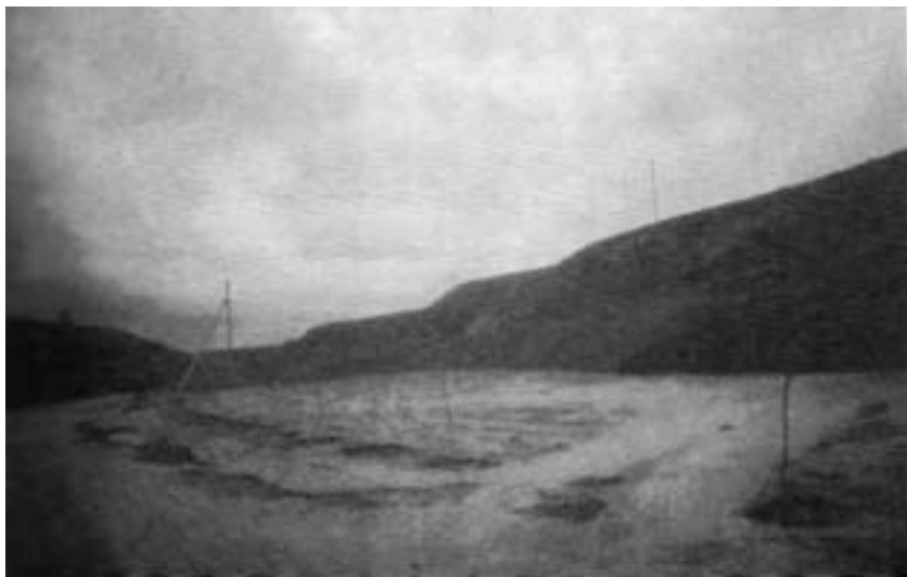
Лисий овраг под Чимкентом, место захоронения расстрелянных в 1937 году